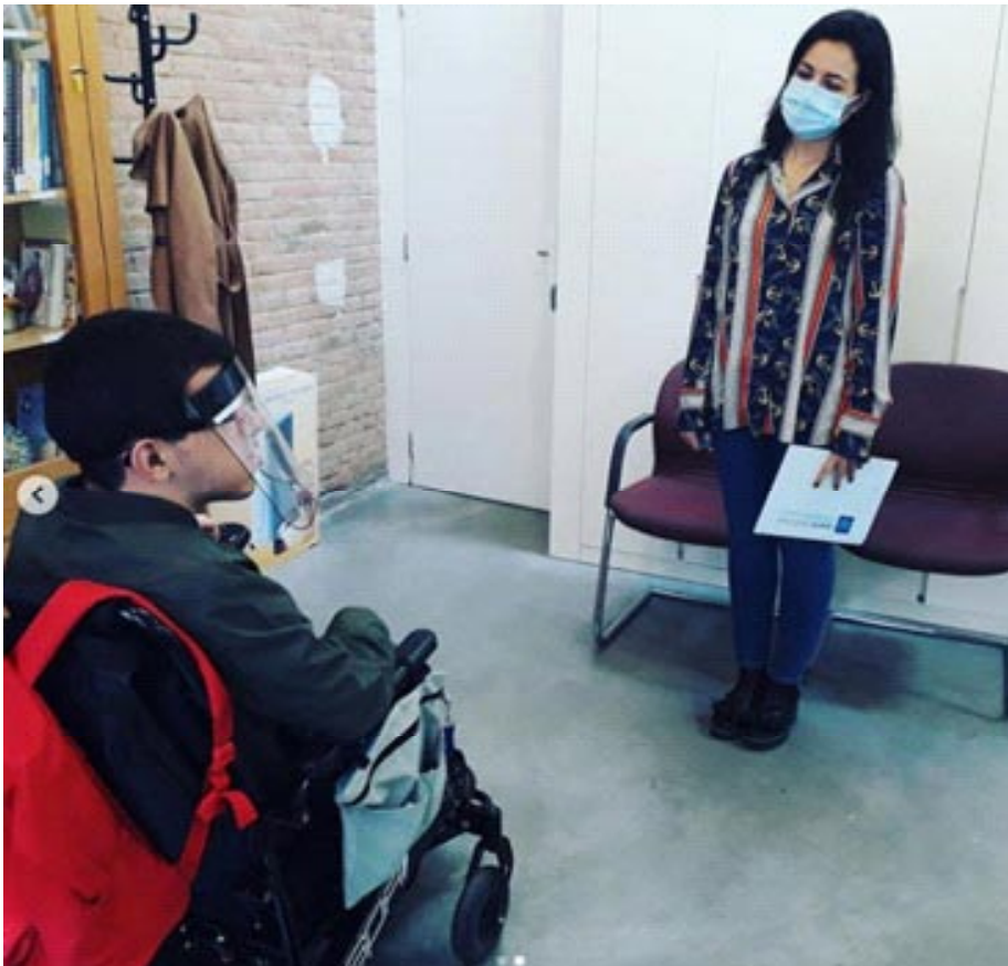
Em aquesta pàgina, imatge d'un dels estudiants en pràctiques. A baix, dues de les portades de la revista Lligam