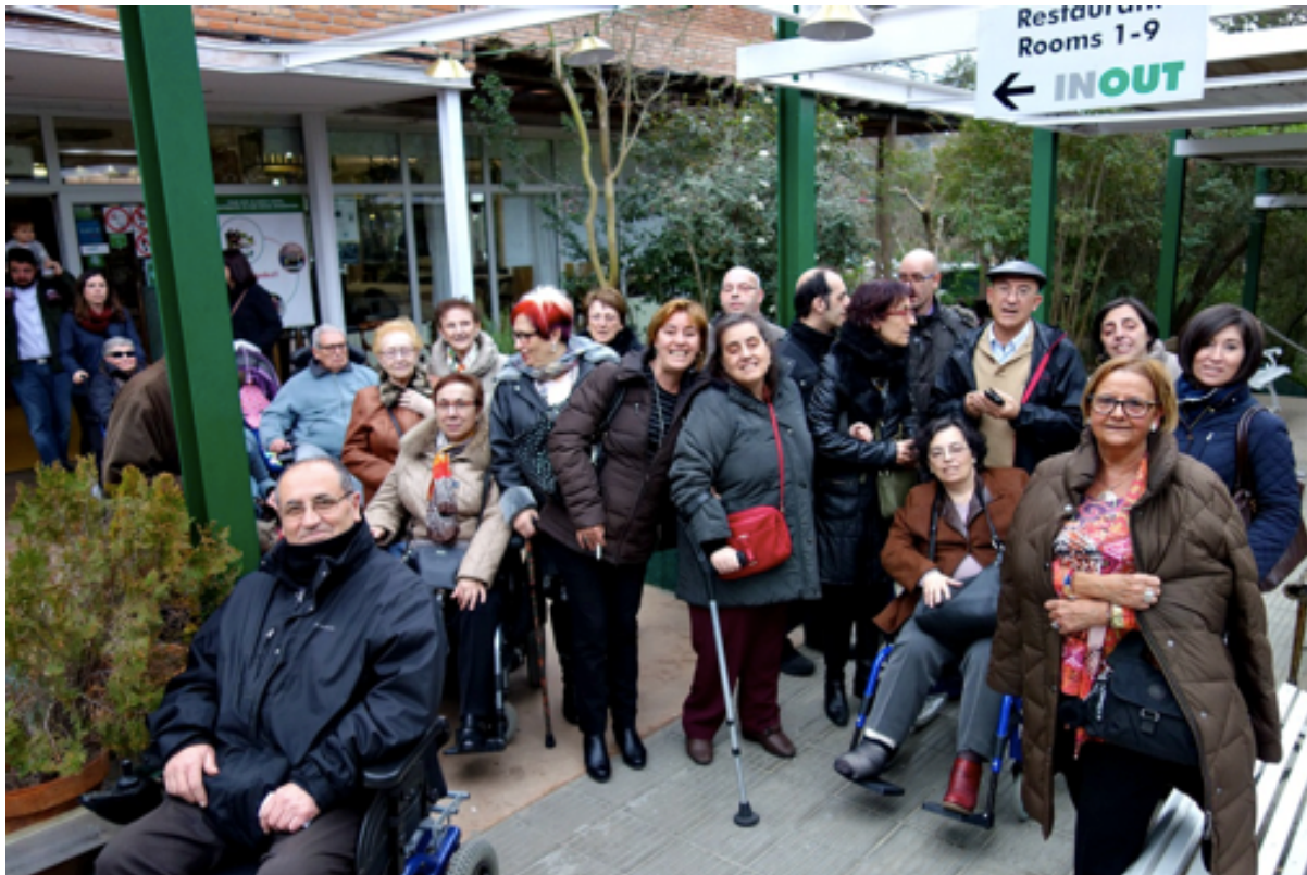
Grup de socis d'Asem Catalunya

El treball comunitari: Promoure la mobilització de les organitzacions, entitats i d'altres recursos existents a la comunitat a fi que els organismes de decisió coneguin les nostres necessitats i articulin els recursos per a la seva solució. El treball comunitari de l'entitat ha de transcendir del treball individual, i donar-li una dimensió social i comunitària.