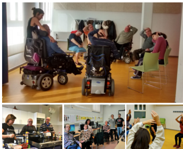
Foto d'alguns tallers d'Asem Catalunya