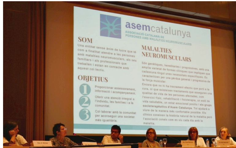
AsemCat participa a la Jornada sobre pacients i associacions organitzada per Vall d'Hebron