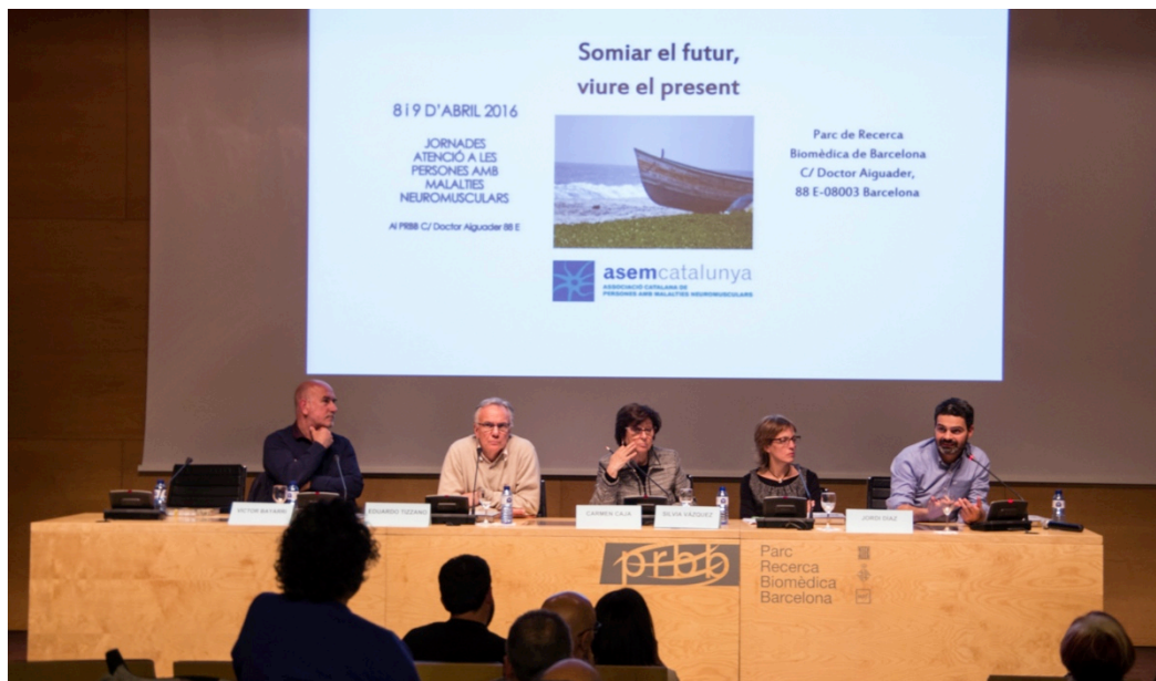
Jornades científiques 2016, al PRBB

Somiar el futur, viure el present , que ha comptat amb l'assistència de 170 persones, entre socis, familiars i professionals de la sanitat. Somiar el futur, per tal de mantenir l'esperança en que la investigació avanci perquè algun dia trobem una medicació que, si no pot curar, al menys aturi l'evolució de la malaltia. Aquest desitjos avui són un somni però demà seran una realitat. És molt important mantenir el somnis, que ens han de servir d'horitzó i de guia per viure el present de la manera més confortable possible, i amb plenitud tot allò que envolta el dia a dia (l'escola, el treball, la vida autònoma, la sexualitat...).