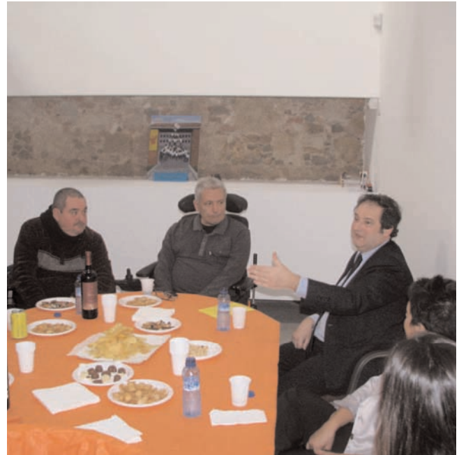
Jordi Hereu en el comiat a ASEM en el nou local

L'ex-alcalde de Barcelona va acomiadar-se de la nostra associació en una trobada informal amb la junta. Durant la conversa Hereu va mostrar-se orgullós del projecte de Fabra i Coats que ha reconvertit un espai industrial en una zona de locals culturals i educatius a més d'equipaments per les entitats socials. Jordi Hereu anunciava una nova etapa amb una dedicació vers altres activitats i allunyat de la política de primera línia. Va animar als responsables de l'associació per tal de que segueixin sent reivindicatius i els demana que estiguin vigilants respecte al procés de construcció dels nous equipament assegurant que hi ha diners pressupostats i reservats per acabar tot el projecte i que no s'accepti l'excusa de la crisi per consolidar-lo.