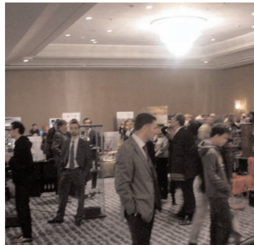
El certamen va ser força visitat

En el marc del Hotel Arts de Barcelona es va celebrar el saló LuxeStyle en el que s'hi exposaven productes luxosos i on simultàniament s'hi feien ponències sobre el sector. Curiosament, tot i la cruesa de la crisi econòmica, els articles de luxe es segueixen venen i força. Asem Catalunya va ser convidada a tenir el seu estand en el que molta gent s'hi va atansar interessada per les activitats que desenvolupa.